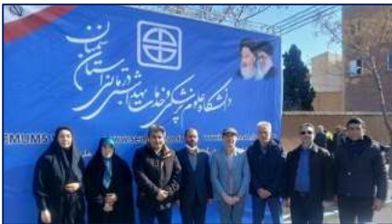
برپایی نمایشگاه و میز خدمت دانشگاه در مسیر راهپیمایی روز ۲۲ بهمن ۱۴۰۳/۱۱/۲۷