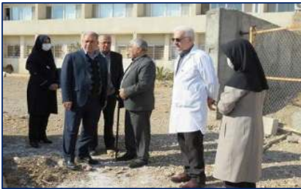
بازدید شهردار سمنان و رئیس خانه صنعت و معدن سمنان از بخش اعصاب و روان بیمارستان کوثر ۱۴۰۳/۱۱/۱۷