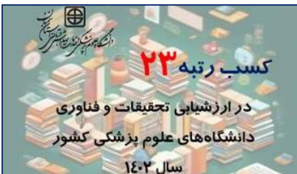
کسب رتبه ۲۳ توسط دانشگاه علوم پزشکی استان سمنان در ارزشیابی تحقیقات و فناوری دانشگاه‌های علوم پزشکی کشور در سال ۱۴۰۲ ۱۴۰۳/۱۱/۲۷